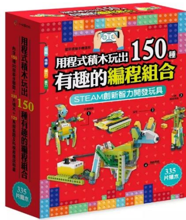
圖二、程式積木玩出 150 種有趣的編程組合(須經由金石教育科技有限公司出貨或其代表合作商出貨之該積木盒)